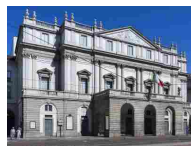
TEATRO ALLA SCALA