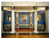
MUSEO TEATRALE ALLA SCALA